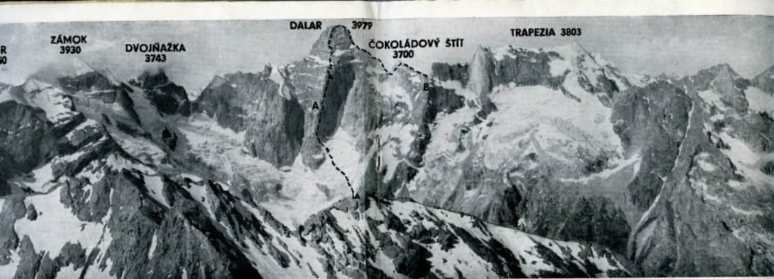
PANORÁMA DOLINY KICKINÉKOL S TRASOU ČS. VÝSTUPU NA DALAR [3979 m] SEVEROVÝCHODNÍM PÍLĚM (A) A PŘES ČOKOLÁDOVÝ ŠTÍT (B). — DOLE: ZAPADNÍ STĚNA KIRPIČ [3802 m] S TRASOU ČS. PRVOVÝSTUPU. — SNÍMKY AUTORA CLÁNKU.

zde přece jen silné ovlivnění Černým mořem, tedy se západokavkazské.